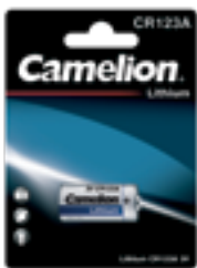
Фото - литиевые элементы питания имеют большую ёмкость и продолжительный срок хранения. Применяются в фототехнике